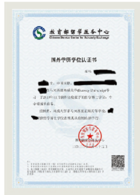
中国教育部 留服学位认证样本