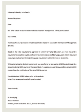
双威大学 录取通知书样本