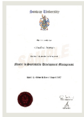
双威大学 毕业证书样本