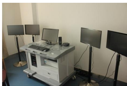
信息行为分析实验室：生理反馈设备

科技信息研究所于 2006 年获得情报学硕士学位授予权，2010 年获批图书情报与档案管理一级学科硕士学位授予权，2014 年获批成为江苏大学校级重点（培育）学科，2018 年获得图书情报专业硕士学位授予权。现已培养毕业研究生 130 余人，在校研究生 100 余人。研究生班 7 届被评为省先进班集体（2009 级、2013 级、2014 级、2015 级、2016 级、2019 级、2020 级），10 人获校级优秀硕士学位论文。